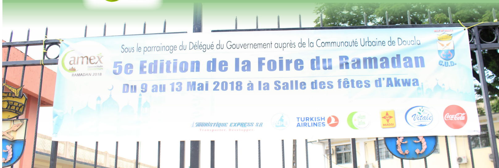
Cérémonie d'ouverture du CAMEX