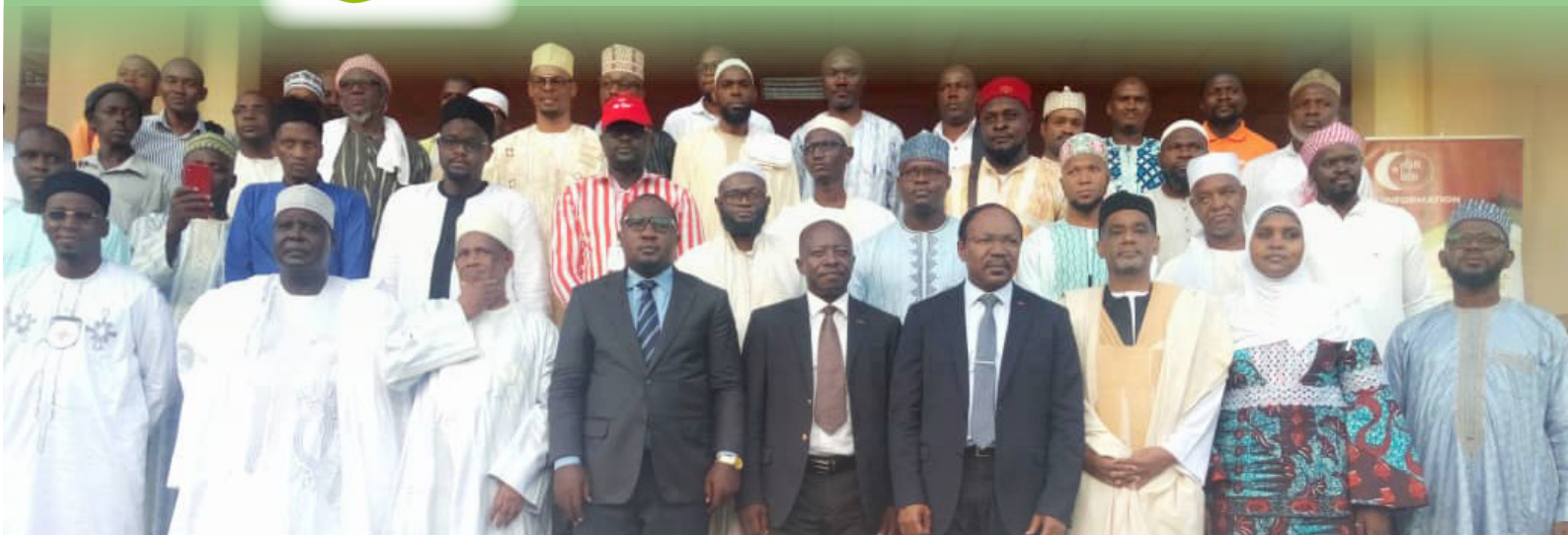
Cérémonie d'ouverture du CAMEX