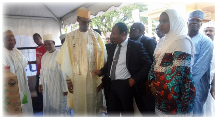
Visite inaugurale des stands